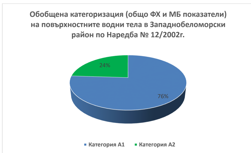
Фигура № 6 Обобщена категоризация по Наредба № 12/2002 г. на повърхностните водни тела в Западнобеломорски район за 2021г.