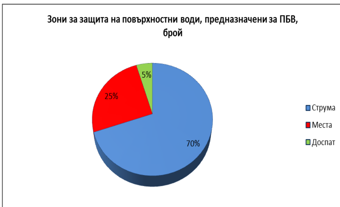
Фигура №1 Разпределение на зоните за защита на повърхностни води, предназначени за питейно-битово водоснабдяване по основни поречия в Западнеломорски район