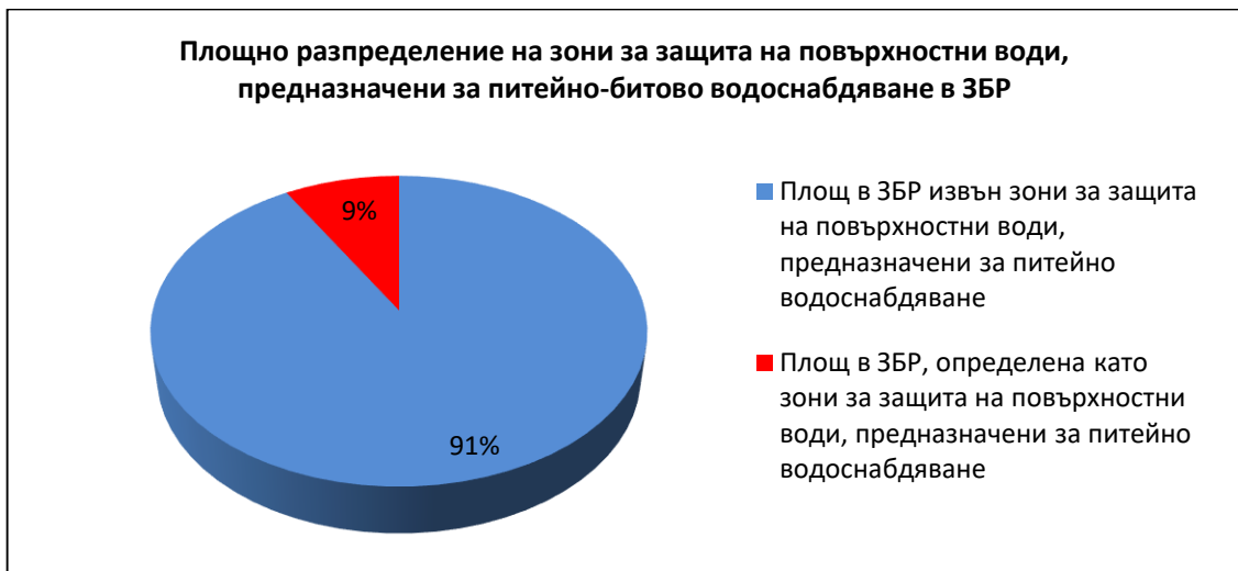
Фигура №3 Дял на повърхностните водни тела, определени като зони за защита на повърхностни води, предназначени за питейно водоснабдяване, спрямо общия брой повърхностни водни тела в Западнбеломорски район.