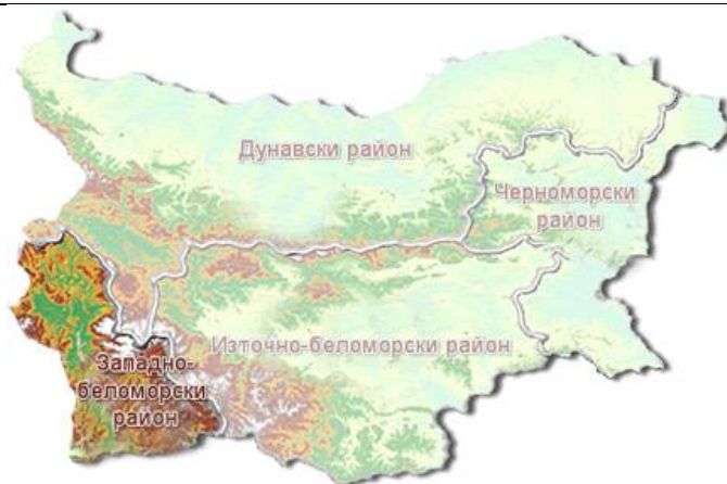
Фигура 1 Териториално разположение на ЗБР

ЗБР се намира в Югозападна България и обхваща около 11 % от територията на страната (11 965 km 2 ). Административен център на района е град Благоевград. Районът обхваща водосборните области на основните реки Струма, Места и Доспат.