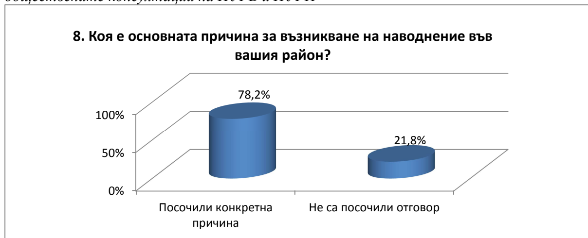
Фигура № 2. Обобщени резултати от Въпрос № 8 на Въпросник от участие в обществените консултации на ПУРБ и ПУРН

От отговорите на Въпрос № 9. „Предприемани ли са мерки за защита от наводнения във Вашия район от 2012г. до момента?“ може да се направи заключението, че за периода след 2012 година, в по-голямата част от районите са предприемани мерки за защита от наводнения. Предприетите дейности са свързани с: