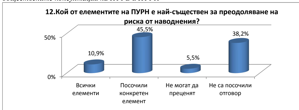
Фигура № 6. Обобщени резултати от Въпрос № 12 на Въпросник от участие в обществените консултации на ПУРБ и ПУРН

Обобщените резултати са визуализирани на Фигура № 6 .