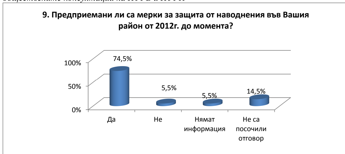
Фигура № 3. Обобщени резултати от Въпрос № 9 на Въпросник от участие в обществените консултации на ПУРБ и ПУРН

Резултатите в обобщен вид могат да бъдат проследени на Фигура № 3 .